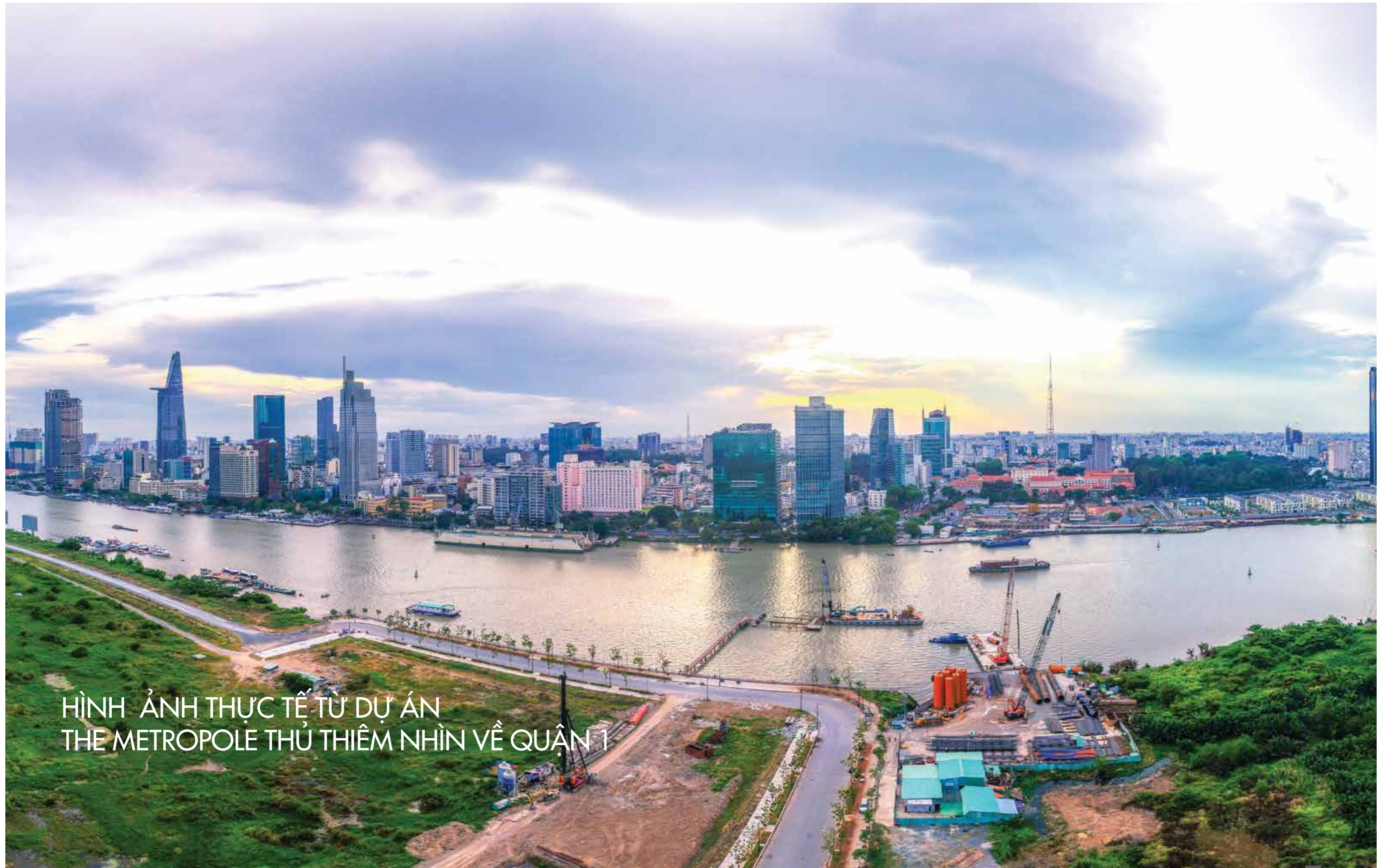
HÌNH ẢNH THỰC TẾ TỪ DỰ ÁN THE METROPOLE THỦ THIÊM NHÌN VỀ QUẬN 1